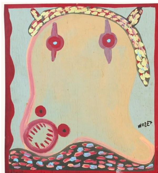
Mose Tolliver, Senza titolo, 1970 ca. Vernice glicero su compensato, 38 x 47 cm

Dal 1° marzo al 19 maggio 2024, l'Accademia di Francia a Roma - Villa Medici presenta la mostra EPOPEE CELESTI. Art Brut nella collezione Decharme , che riunisce una selezione di 180 opere della collezione di Bruno Decharme , una vera e propria panoramica sull'art brut.