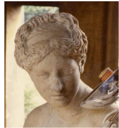
Tête volée / Testa rubata