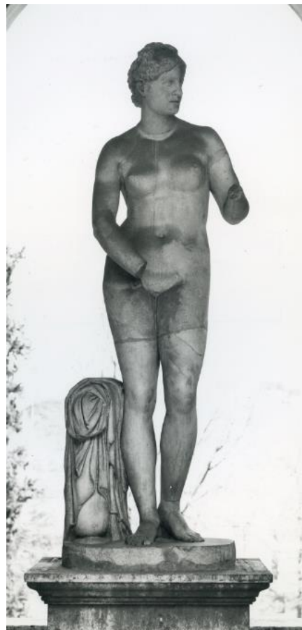
Villa Médicis