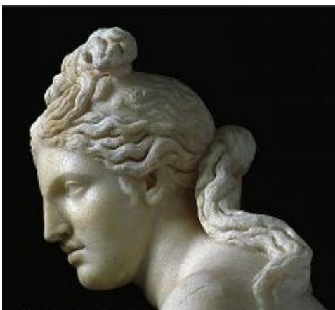
Venere Capitolina

Tuttavia, tanto la statua quanto la testa con la sua chioma possono essere messe in relazione anche con la Venere Cnidia (copia romana da originale greco in bronzo di Prassitele, IV s. a.C, Museo Pio Clementino - Musei Vaticani ).