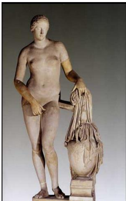
Afrodite Colonna, copia in marmo dall'originale in bronzo di Prassitele, 365 a.C. circa. Città del Vaticano, Museo Pio Clementino, Sala delle Maschere. Donata al papa Pio VII da Filippo III Colonna, conserva la denominazione della nobile famiglia