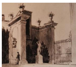
Blouet, dessin (détail)

La testa di Meleagro, in marmo pario, posta sulla statua non era pertinente e fu rimossa e conservata nel palazzo di Villa Medici. Si tratta di una replica di tipo scopadeo e fu a lungo creduta un originale greco e attribuita a Skopas stesso (Petersen, Collignon, Lawrence) o un'ignota opera lisippea (Matz-Duhn, Hyde, Johnson) e infine creduta appartenere alla cerchia scopadea (Boralevi-Mancinelli, Curtius). Cagianò de Azevedo l'attribuisce a Skopas e la data intorno al 340 a.C. mettendola in relazione con i frontoni di Tegea.